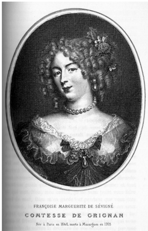
Fig. 6. Portrait de la comtesse de Grignan, des collections privées.