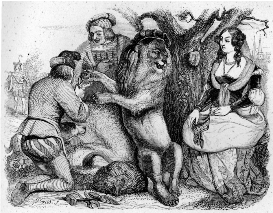
Fig. 5. Gravure de Grandville illustrant les Fables éditées par Garnier fr. Paris, 1876, 4, I, p. 147–9, coll. de l'auteur.