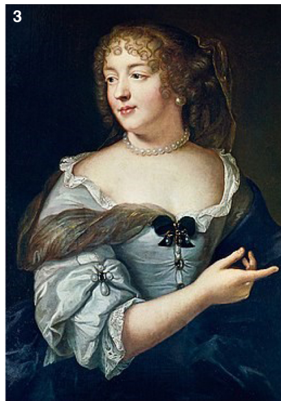
Figs. 1-3. La marquise de Sévigné à son écritoire, Musée carnaulet, Paris.

Comment ne pas ressentir la fragilité de la condition humaine après tous ces deuils. Mariée à dix-huit ans au frivole marquis Henri de Sévigné, de haut lignage breton, mais mourut en duel pour les beaux-yeux d'une belle. De ses sept années de vie conjugale, la marquise eut deux enfants, son fils Charles embrassa aussi la carrière militaire et sa fille Françoise, qu'elle entoura d'une 'excessive tendresse' et de la meilleure éducation pendant sa jeunesse à l'hôtel Carnavalet. Françoise était aussi belle et spirituelle que sa mère. Elle dansait avec la grâce de ses quinze ans à la cour de Versailles. Considérée la plus jolie fille de France, le Roi l'avait remarquée, c'est pourquoi Jean de La Fontaine lui dédia non sans malice sa fable Le lion amoureux , que récite avec bonheur Fabrice Luchini (Fig. 5).