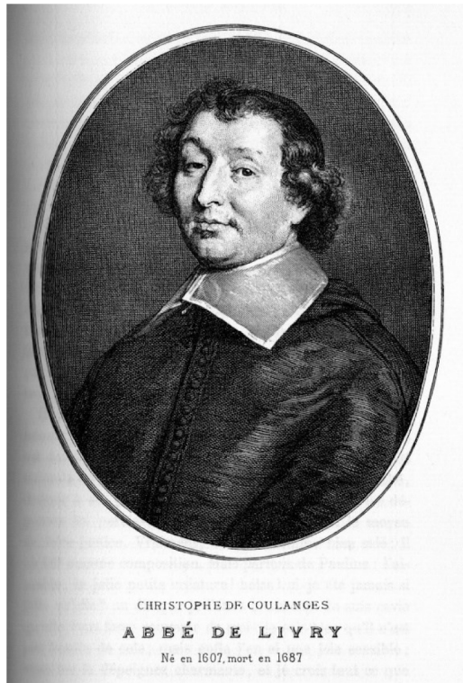
Fig. 4. Portrait de l'Abbé de Livry, collection privée.

filles y répondra mieux, Étant sans ces inquiétudes. Le Lion consent à cela, Tant son âme était aveuglée ! Sans dents ni griffes le voilà, Comme place démantelée. On lâche sur lui quelques chiens : Il fit fort peu de résistance. Amour, amour, quand tu nous tiens, On peut bien dire : Adieu prudence (Fig. 6).