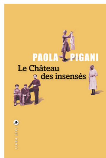
Le château des insensés Editions Liana Levi 2024

De surcroît, ces médecins et des malades vont braver tous les risques et y créer un foyer de résistance à l'occupant.