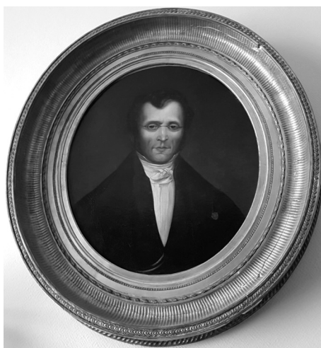
FIG. 2. — Portrait de Pierre-Charles Alexandre Louis, pionnier de la médecine fondée sur la preuve. Académie nationale de médecine.