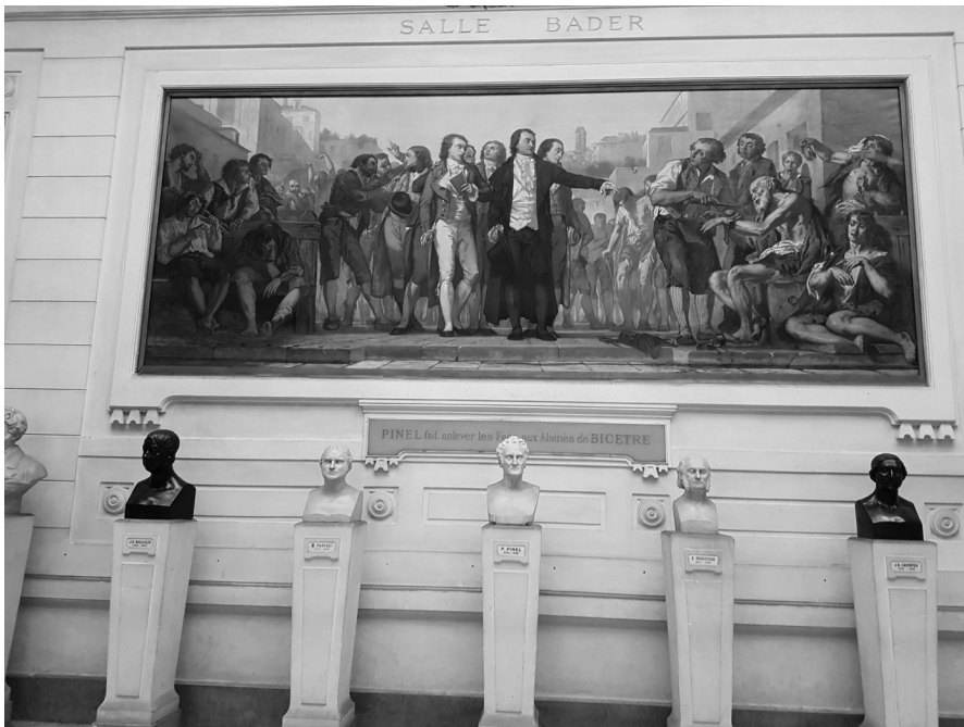
FIG. 3. — Philippe Pinel délivrant les aliénés de leurs fers à Bicêtre (1793). Tableau de Charles Louis Müller. Académie nationale de médecine.